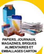
PAPIERS, JOURNAUX, MAGAZINES, BRIQUES ALIMENTAIRES ET EMBALLAGES CARTON

CHEZ VOUS, TOUS LES EMBALLAGES SE TRIENT