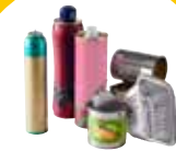
EMBALLAGES EN MÉTAL, BOÎTES DE CONSERVE...