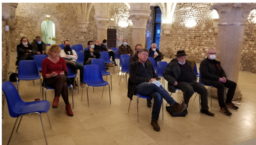
Photographies de la réunion publique du 8 mars 2022