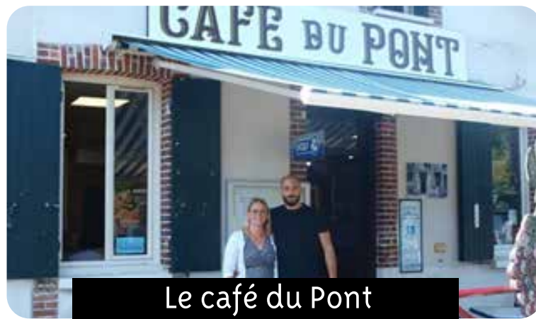
Le café du Pont

Fermeture les mardis toute la journée et les dimanches soir