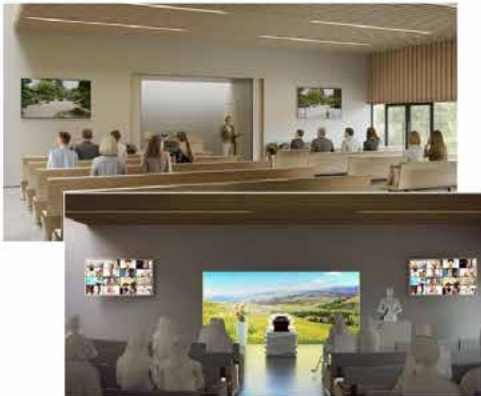
Le salon dédié aux cérémonies: un cadre moderne, lumineux et soigné pour le recueillement des familles.

La préoccupation esthétique a été un facteur déterminant dans le choix du futur équipement, qu'il soit question des salons d'accueil et de cérémonie où des abords extérieurs et notamment du jardin du souvenir. A chaque étape, l'accueil optimal des familles a déterminé l'architecture du projet.