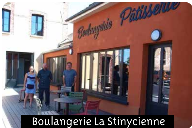
Boulangerie La Stinycienne

La boulangerie « La Stinycienne » a ouvert le jeudi 25 juillet dernier dès 7 heures au grand bonheur des habitants d'Étigny. La boulangerie est située 12 Grande Rue 89500 Étigny.