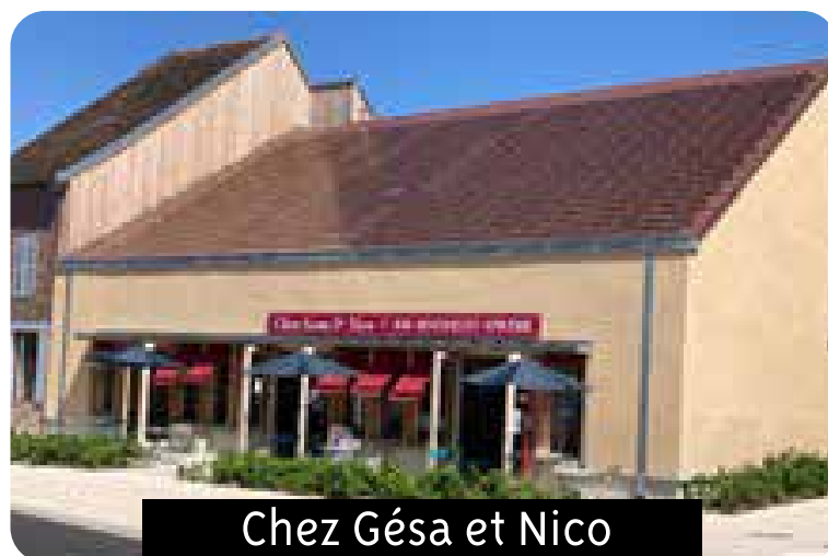
Chez Gésa et Nico

Du lundi au samedi de 12h00 à 15h00 et de 19h à 23h 03.86.96.04.59 ou 07.81.51.35.92 5 impasse Saint-Vincent à Saint-Denis-Les-Sens